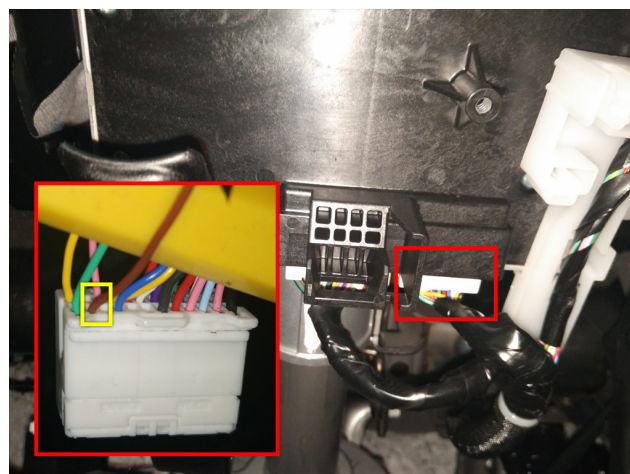
Рис.4 Подключение стартера