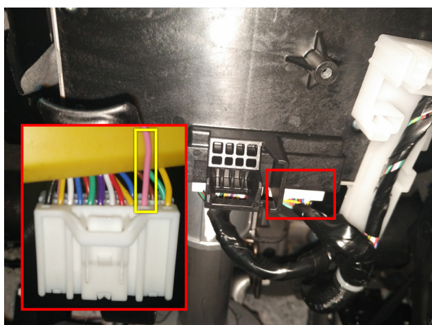
Рис.3 Подключение зажигания