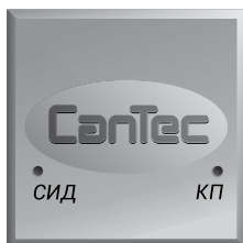
Рис. 1. Модуль CANTEC-F1 v5

Назначение выводов модуля описано в таблице 1. Нумерация контактов в разъеме указана на рисунке 2. Конфигурирование входов/выходов осуществляется с помощью программирования (см. раздел «Программирование аппаратных функций модуля»).